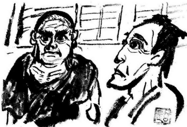
「もし、幕府軍との戦いになれば、貴殿は土佐勢を率いて、加勢に来てくれぬか」と西郷隆盛

容堂は容堂で、この時期、大政奉還という大芝居を考えていた。それは後藤象二郎、福岡孝弟、寺村左膳、神山左多衛らの側近を使って、話し合いの中で、政権を朝廷に返還する手段を考えていたのである。