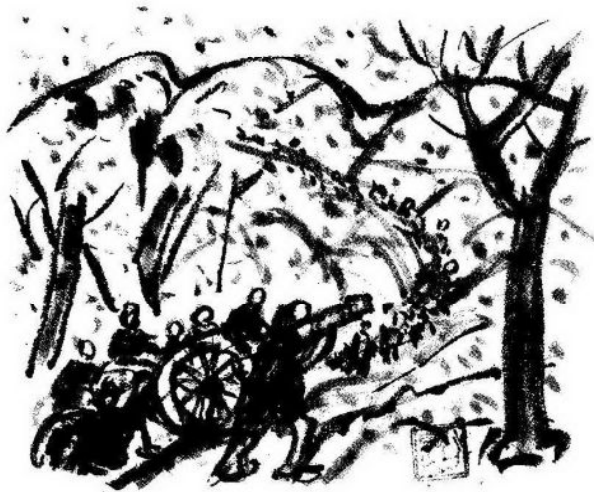
大雪の中、六門の大砲を引いて、 「笹ヶ峰」を越える「迅衝隊」600名の行軍