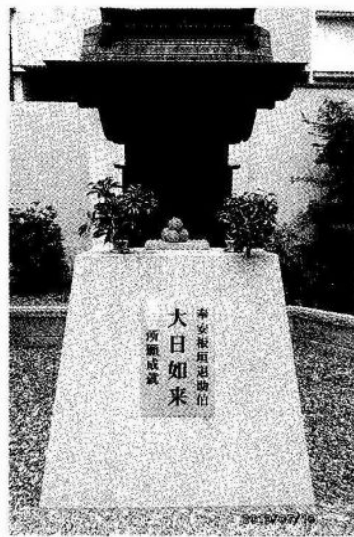
高知・高野寺境内の小堂