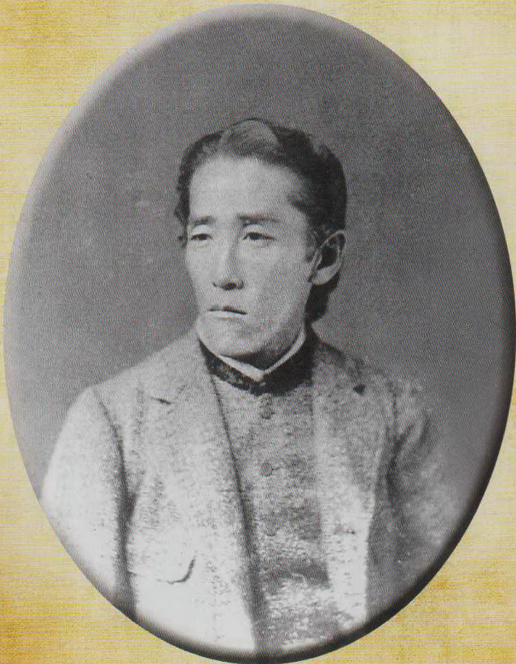
若き日の板垣退助