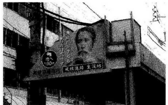
アーケードの案内板